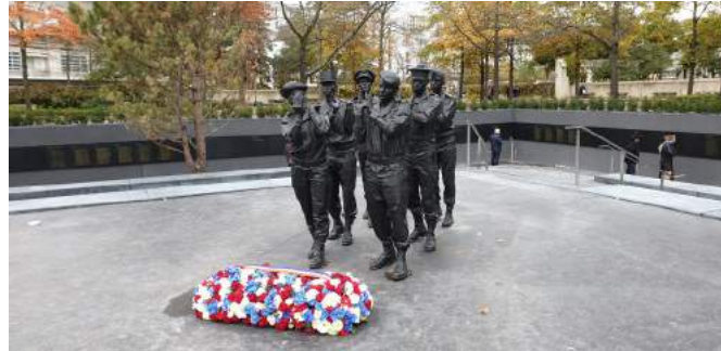
Monument aux morts pour la France en opérations extérieures (Paris 15e)