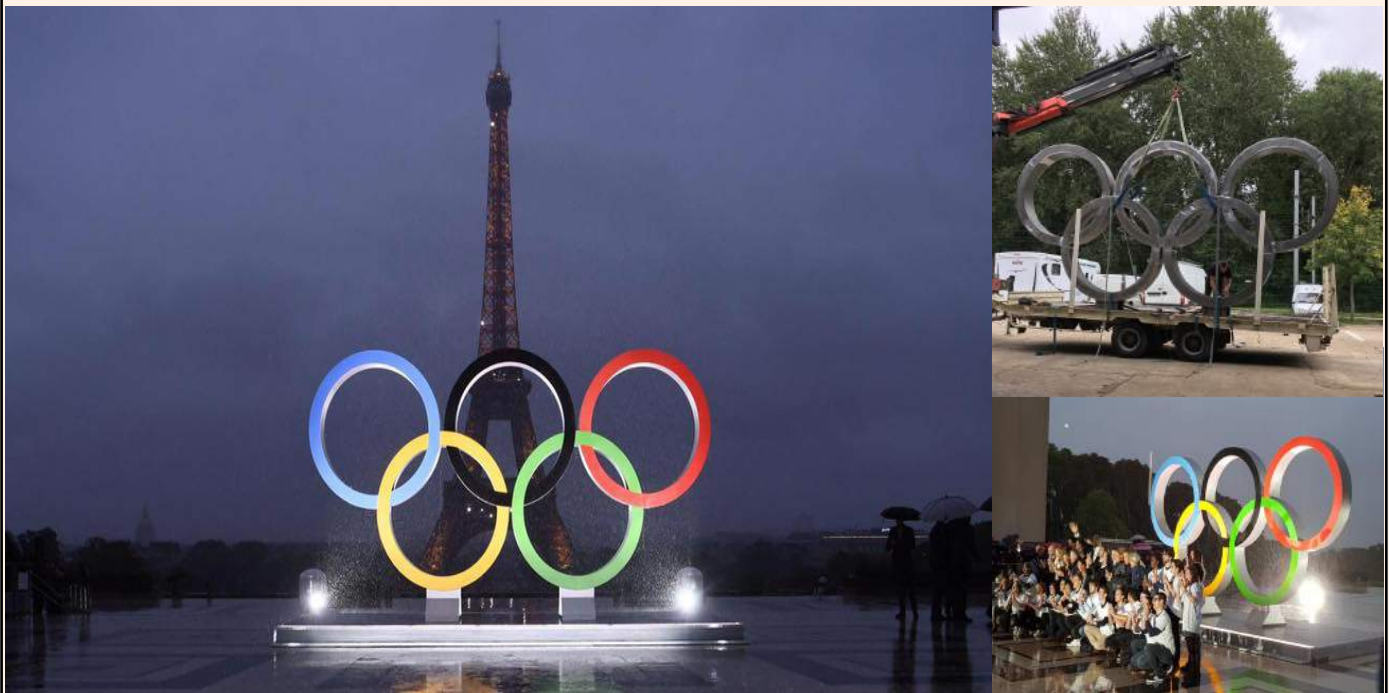
Anneaux Olympiques au Trocadéro !!!

Bravo à l'entreprise Crapeau pour cette magnifique réalisation !!!